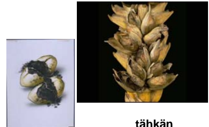
tähkän sairastuminen: nokipallojen muodostuminen